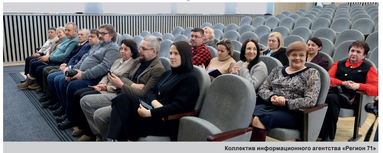
Коллектив информационного агентства «Регион 71»

Сегодня газеты регулярно готовят специальные выпуски, посвященные важным событиям в