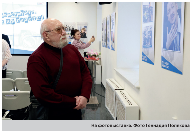
На фотовыставке.

жизни региона: Дню Тульской области, Тульскому экономическому форуму, фестивалю «Дикая мята», годовщинам Победы в Великой Отечественной войне, юбилею Тульского кремля и многому другому, что считается правдой современной жизни.